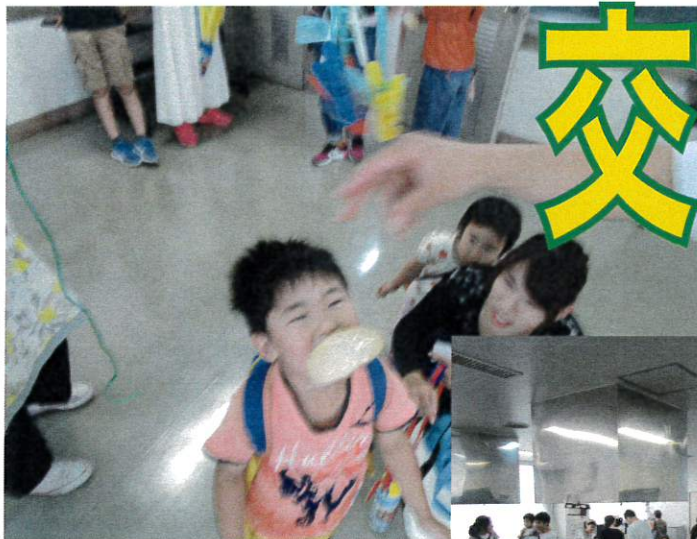
伝統のパン食い競争！