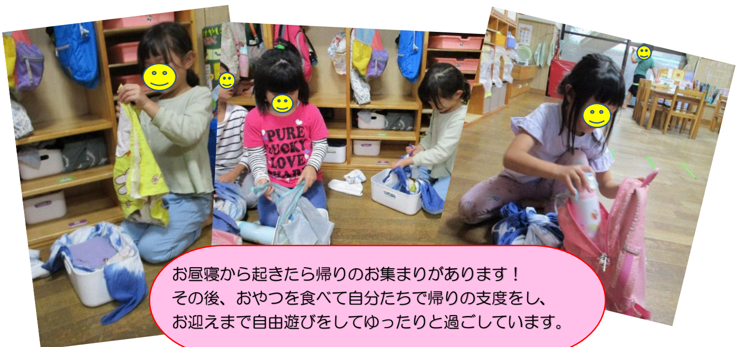
お昼寝から起きたら帰りのお集まりがあります！その後、おやつを食べて自分たちで帰りの支度をし、お迎えまで自由遊びをしてゆったりと過ごしています。