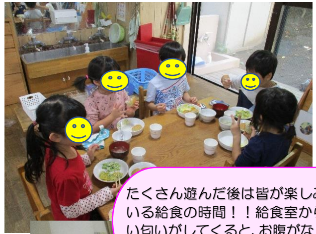
たくさん遊んだ後は皆が楽しみにしている給食の時間！！給食室からおいしい匂いがしてくると、お腹がなってしまいます(*^-^*)