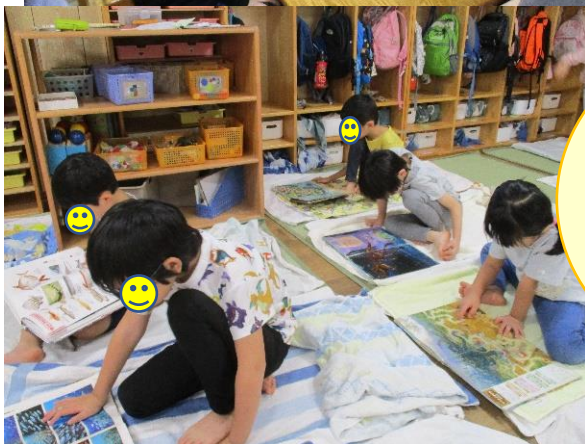
寝る前には1人1冊好きな本を見ている。時間になると電気を消し、疲れた身体を休めます。