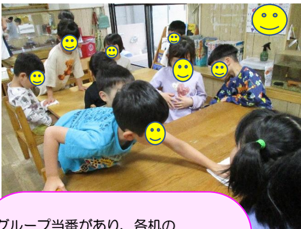
グループ当番があり、各機の5歳児の子が机を拭いたりします。